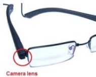
Figuur: Normaal uitziende bril met camera

Als het toezicht bij het examen goed is georganiseerd wordt het spieken met technische hulpmiddelen lastiger, maar zeker niet onmogelijk. De brildrager blijkt in zijn bril een camera te hebben, ergens in zijn kleding een bluetoothapparaat en in zijn gehoorang kleine bluetooth speakertjes nog kleiner dan het topje van een pink. Een hulpje buiten de examenruimte zegt het juiste antwoord voor.